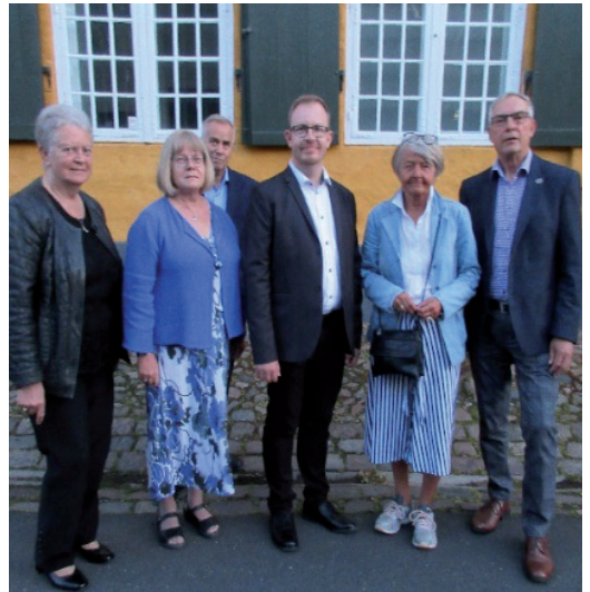
Efter ordinationen i Roskilde